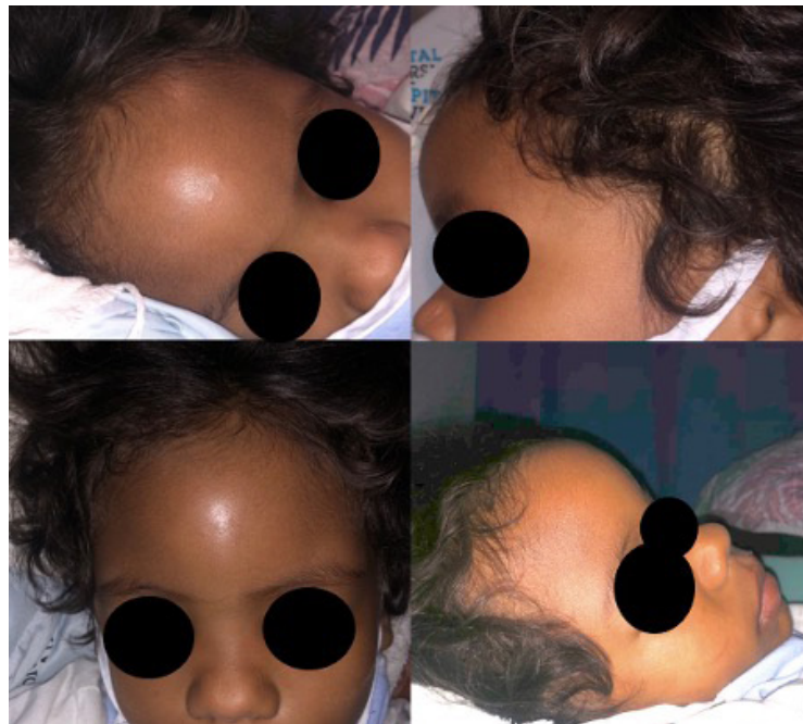
Imagen 1. Presentación clínica del tumor de Pott Vista frontal y lateral y tumoración en región frontal.

Se declara que no existe ningún conflicto de interés por parte de los autores.