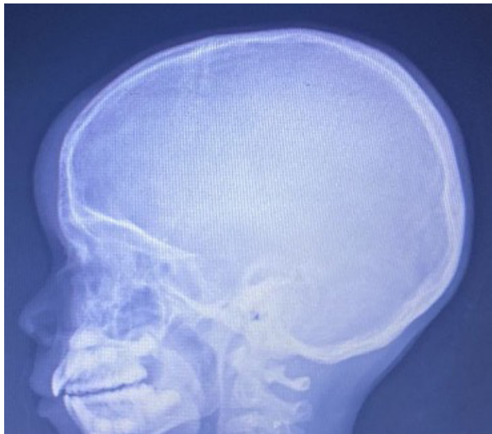
Imagen 2. Aspecto radiológico del tumor de Pott. Radiografía de cráneo simple. Se evidencia edema de tejidos blandos en región frontal con compromiso óseo