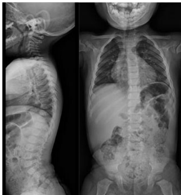
Figura 3. Radiografía de columna total proyecciones lateral y AP. Se evidencia hiperlordosis lumbar sin platiespondilia.