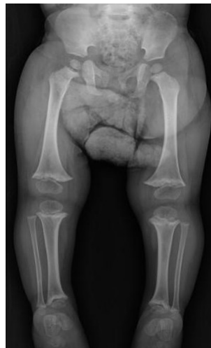
Figura 1. Ortoradiografía de miembros inferiores en bipedestación. Acortamiento longitudinal de fémur, tibia y peroné bilateral, ensanchamiento metafisario con irregularidad del contorno proximal y distal, sin compromiso epifisario. Genu varo bilateral.

Acorde a la valoración multidisciplinaria y dada la progresión de la deformidad y el genu varo evidente con la marcha, se consideró que el paciente requería manejo quirúrgico, por lo que se programó para fisiodesis de fémur y tibia distal, así como osteotomía desrotadora tibial hacia externo.