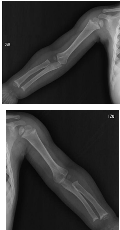
Figura 2. Radiografía de huesos largos – miembros superiores. Ensanchamiento metafisario con irregularidad del contorno proximal y distal del humero, radio y cubito bilateral, sin compromiso epifisario. Las diáfisis son normales.