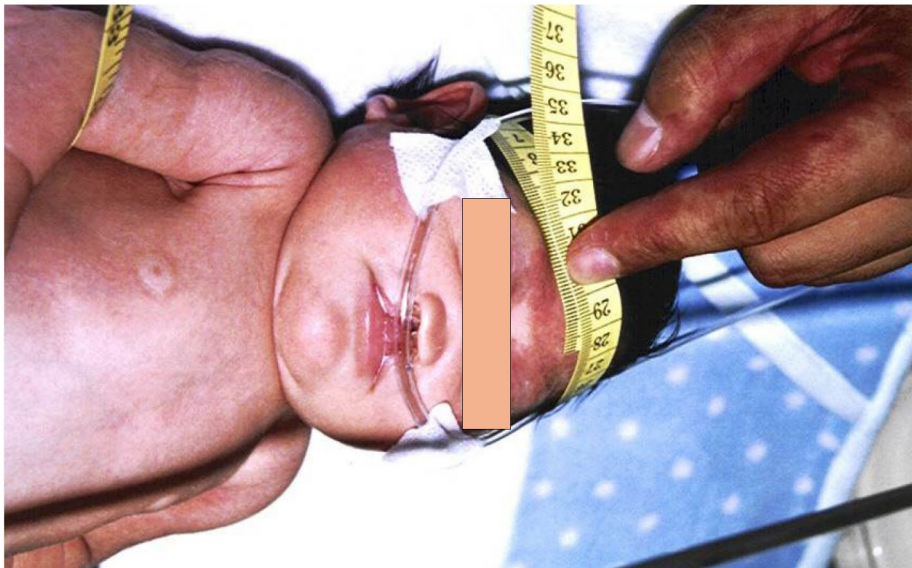
Figura 2. Presentación clínica

Se observa perímetro cefálico de 27 cm compatible con microcefalia, hipertelorismo ocular, puente nasal plano, hendidura labial unilateral completa, hendidura palatina completa, pabellones auriculares displásicos de implantación baja rotada y manos con inclusión del pulgar